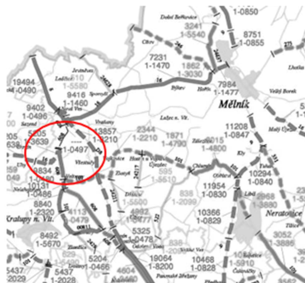
Tab. B.1: Příklad dopravních intenzit podle CSD 2000 pro úsek 1-4790 komunikace II/101