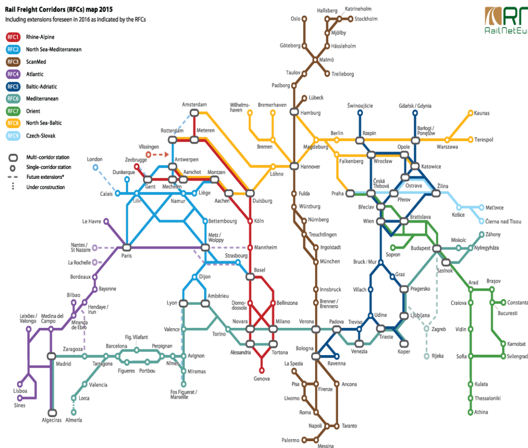
Obrázek 2 Síť koridorů RFC v Evropě

Koordinace činností a kooperace je v rámci koridorů založena na horizontální a vertikální spolupráci, která probíhá mezi ministerstvy a správci železniční infrastruktury. Tímto prvkem se RFC liší od ostatních koridorů. V rámci Výkonné rady (ministerstva) a správní rady (správce infrastruktury) jsou několikrát ročně vždy za příslušný koridor projednávány otázky rozvoje a dalšího směřování. Nadto nařízení zavádí také tzv. poradní skupinu dopravců a terminálů, které hájí zájmy podnikatelského sektoru a na pravidelných jednáních se vyjadřují k řízení, rozvoji a potřebám koridorů. Navzdory konzervatismu železničního sektoru lze i v ČR zaznamenat nárůst zájmu o produkty RFC, třebaže se mezi jednotlivými koridory liší.